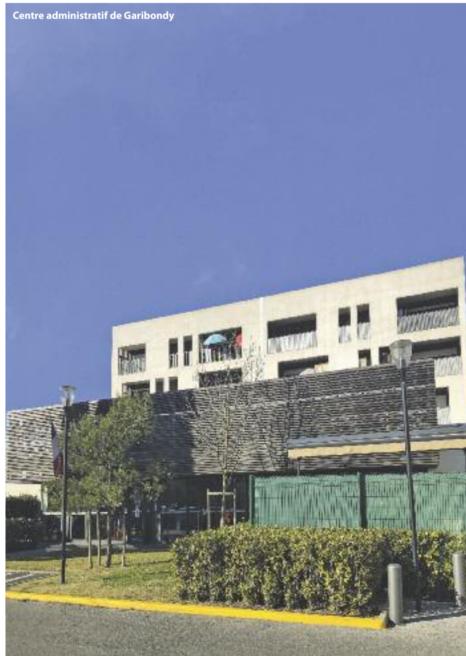
Centre administratif de Garibondy