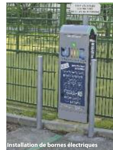
Installation de bornes électriques