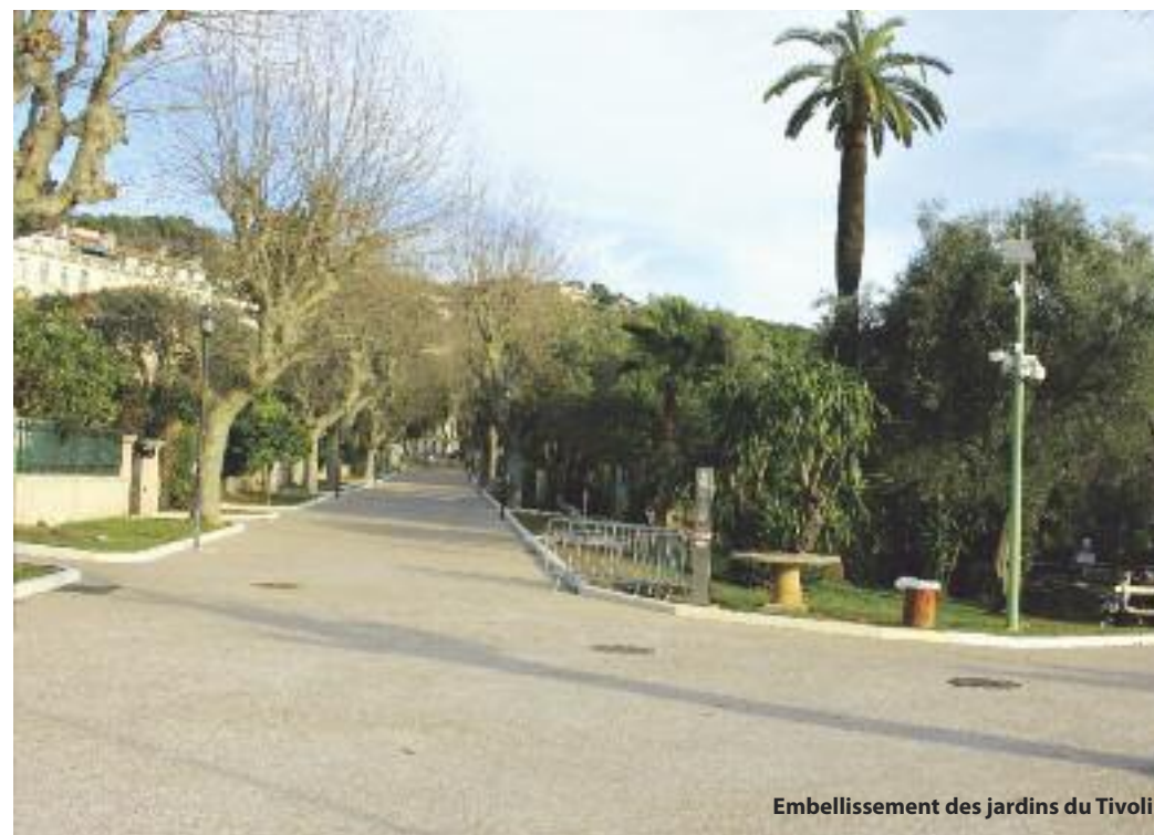
Embellissement des jardins du Tivoli