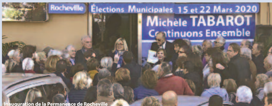
Inauguration de la Permanence de Rocheville

Permanence Carnot 113 boulevard Sadi Carnot