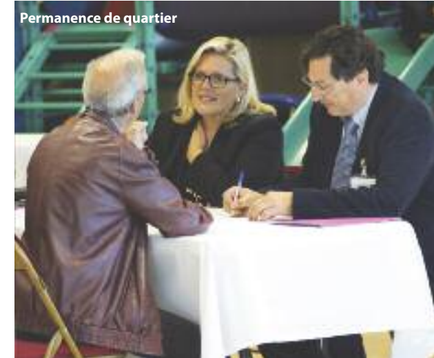
Permanence de quartier