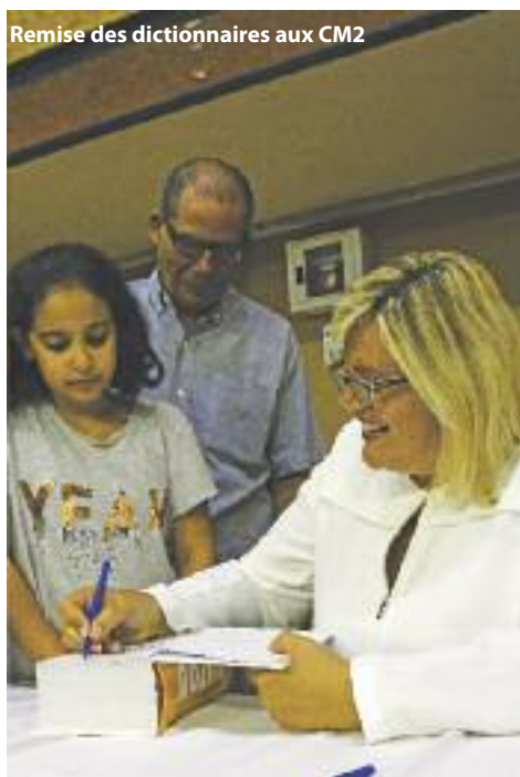
Remise des dictionnaires aux CM2