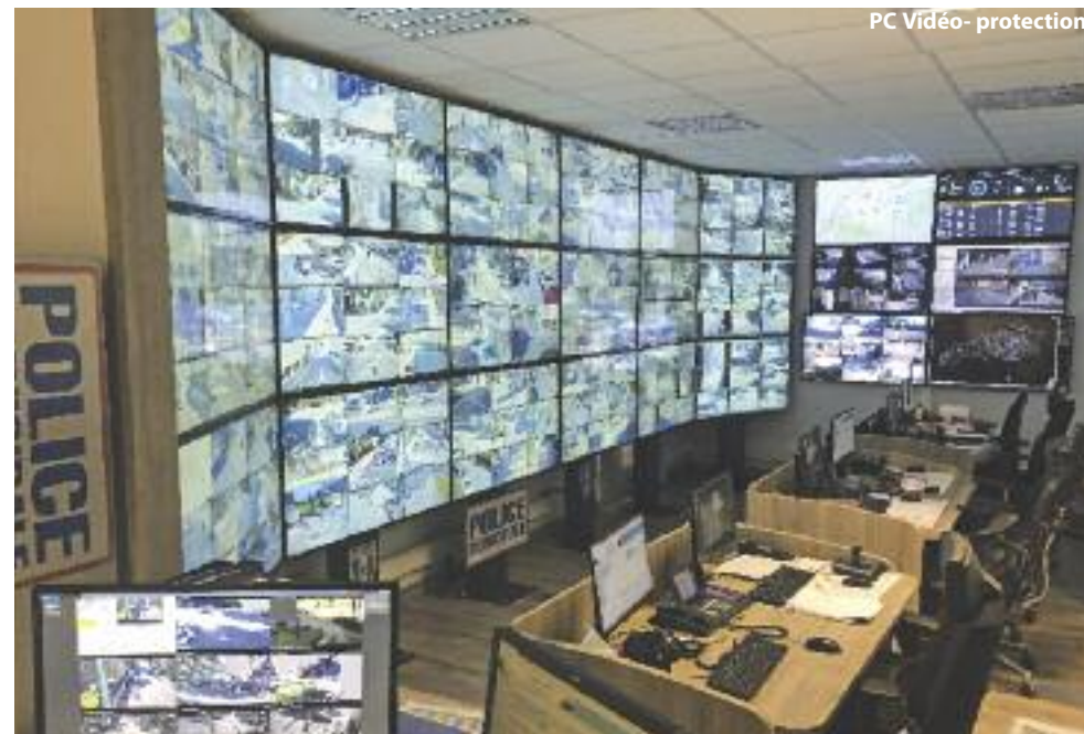
PC Vidéo- protection