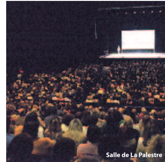
Salle de La Palestre