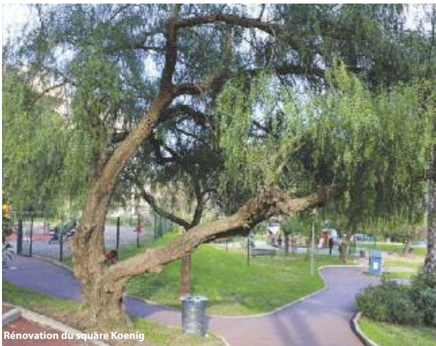
Rénovation du square Koenig