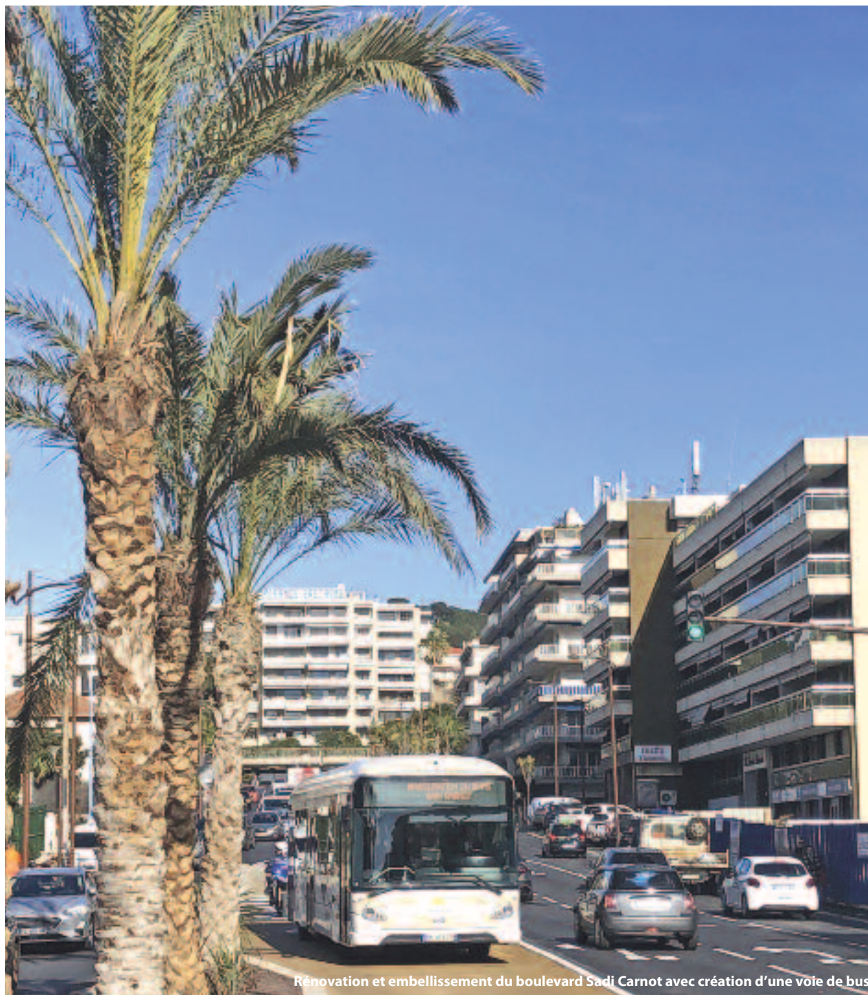
Rénovation et embellissement du boulevard Sadi Carnot avec création d'une voie de bus