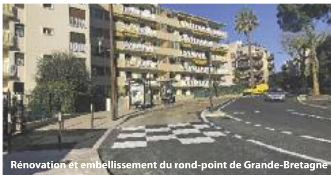
Rénovation et embellissement du rond-point de Grande-Bretagne