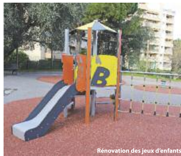
Rénovation des jeux d'enfants