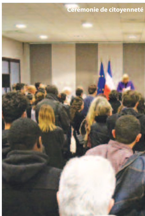
Cérémonie de citoyenneté