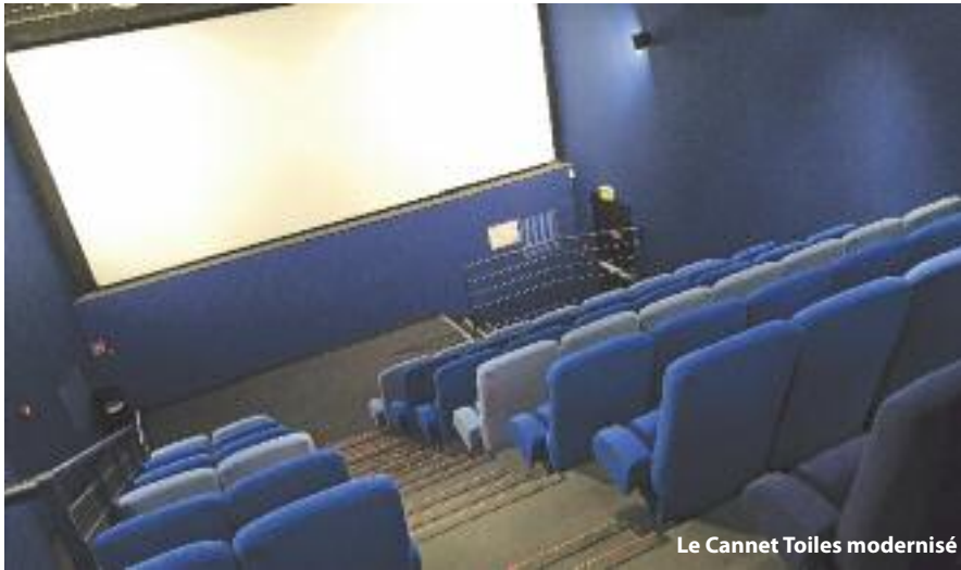
Le Cannel Toiles modernisé