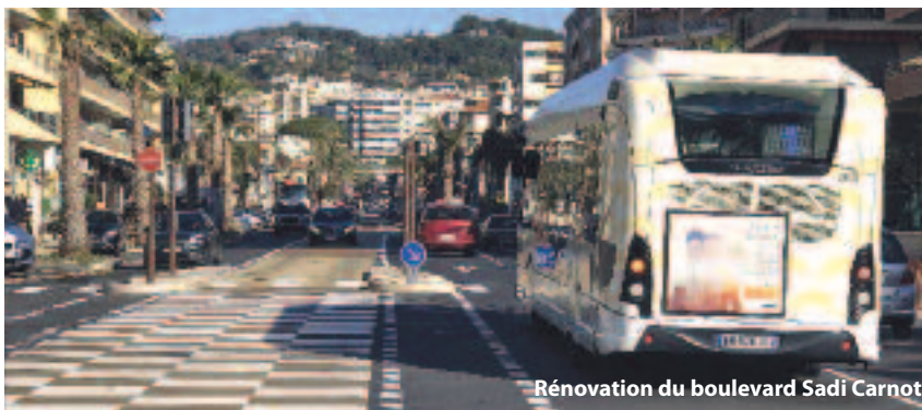
Rénovation du boulevard Sadi Carnot