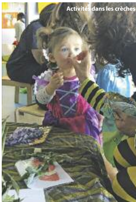
Activités dans les crèches