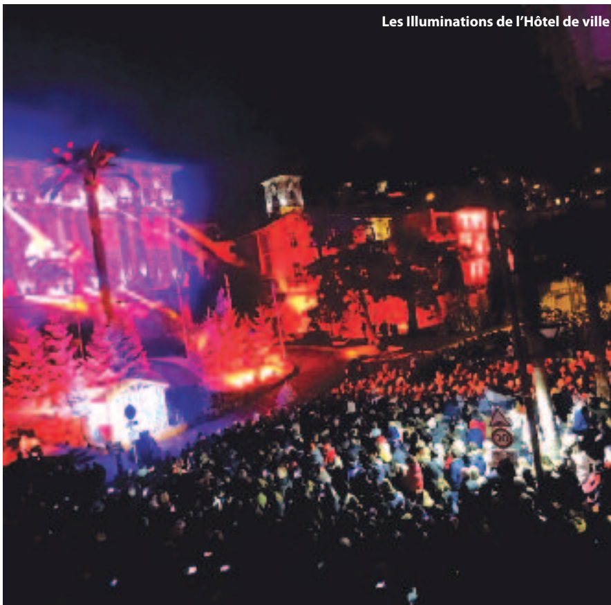
Les Illuminations de l'Hôtel de ville