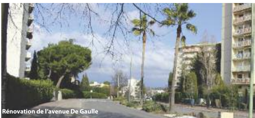
Rénovation de l'avenue De Gaulle